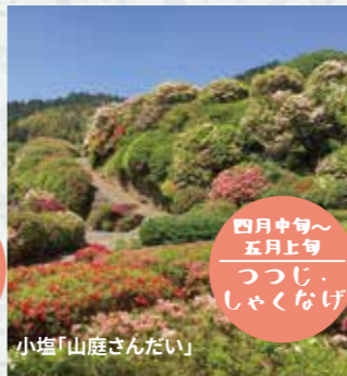
小塩「山庭さんだい」