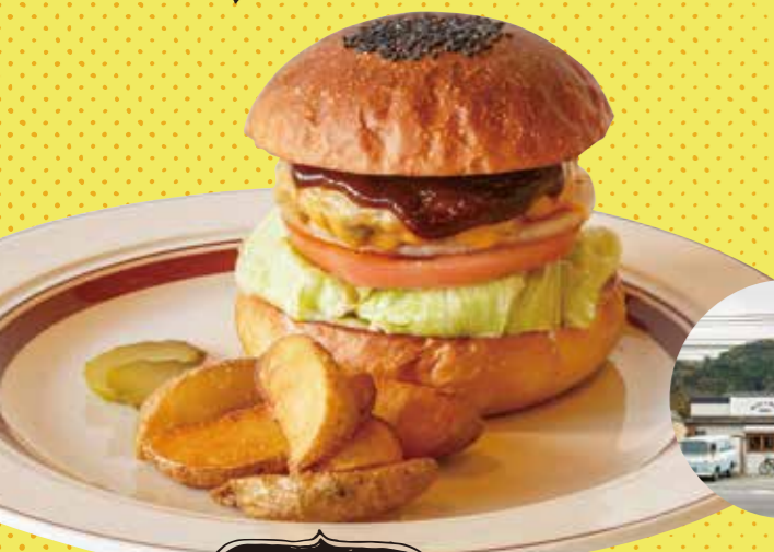
コワモテ且つ繊細 Deli★Boy BROS. Hamburger ハンバーガー

「経営後回し。手頃に満足してもらえれば」と豪語する店の、地元人気メニュー。価格からは考えられないボリュームのお肉だが、うまみたっぷりの特製ダレでペロリといただける。