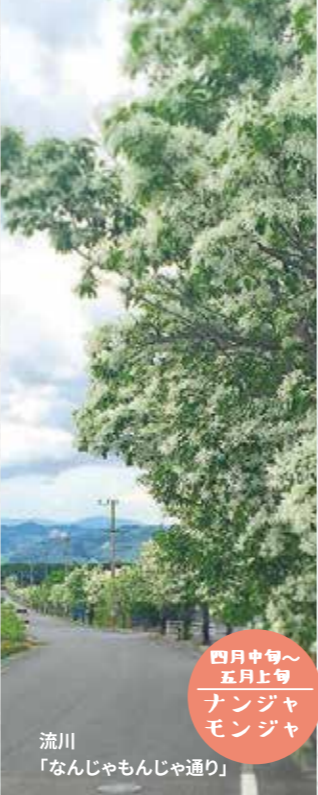
流川「なんじゃもんじゃ通り」