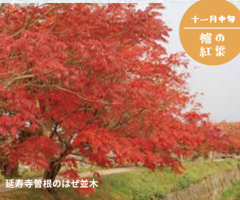
延寿寺曾根のはぜ並木