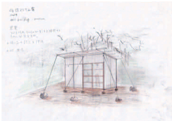
作品イメージ(オレクトロニカによるドローイング)

2011年から「制作と生活」をテーマに大分県竹田市を拠点に活動している「オレクトロニカ」と佐賀大学生5名による作品。園内に、市民の皆さんと作る臨時アートセンターを設置し、学生によるサポートのもと皆さんの創作・表現活動のはじめの一歩を応援。オレクトロニカアートセンター内での展示やパフォーマンス・路上表現などやってみたい人募集。 ※募集内容については、後日、石橋文化センターホームページで公開